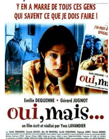
Figure 2 : Film Oui, mais...

C'est ce dernier champ que vous explorerez durant votre travail de maturité puisque ce thème est inscrit en Economie.